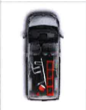
Banquettes arrière amovibles