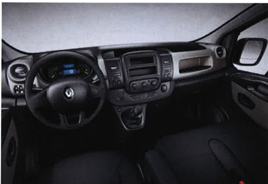
Visuel présenté sans l'équipement Airbag passager (de série)

CHOISISSEZ LE NIVEAU D'ÉQUIPEMENT QUI VOUS CORRESPOND.