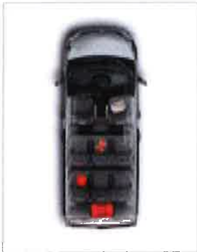
Configuration 8 places avec siège passager avant individuel