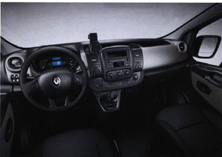
Visuel présenté avec l'option support smartphone