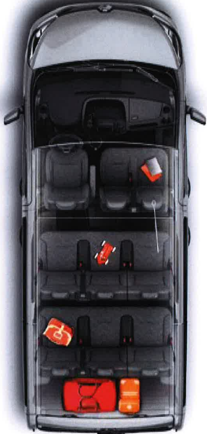
Jusqu'à 9 places