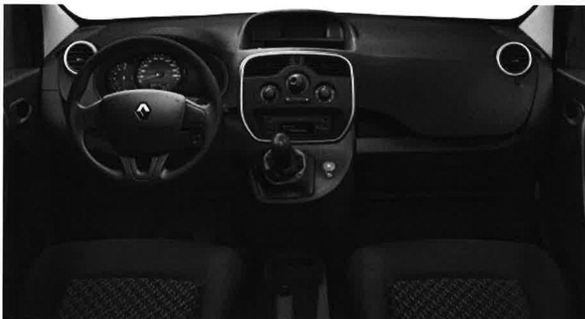
Modèle présenté avec climatisation manuelle et radio disponibles en option. Sellerie Titane (Kangoo).

NIVEAUX D'ÉQUIPEMENT, TEINTES, OPTIONS, À VOUS DE JOUER !